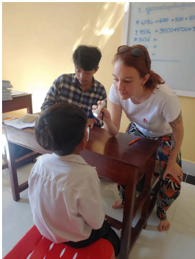
Je fais un don

Laos - Vientiane - Octobre - Novembre 2025